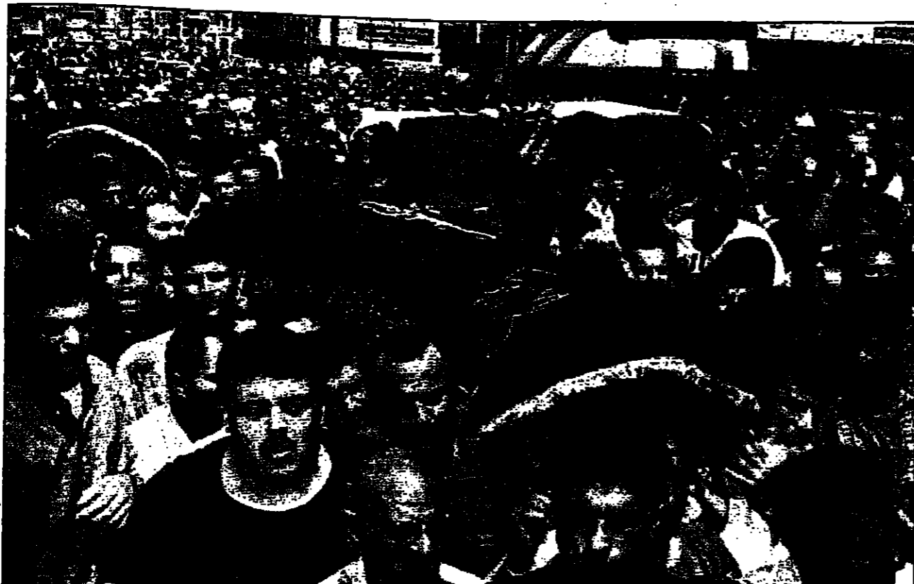
اللاجئ من سكان صيدا يشبهون يوم اربعة من الشهداء الذين تنتم الكاتيف الاسرائيلية امس الاول